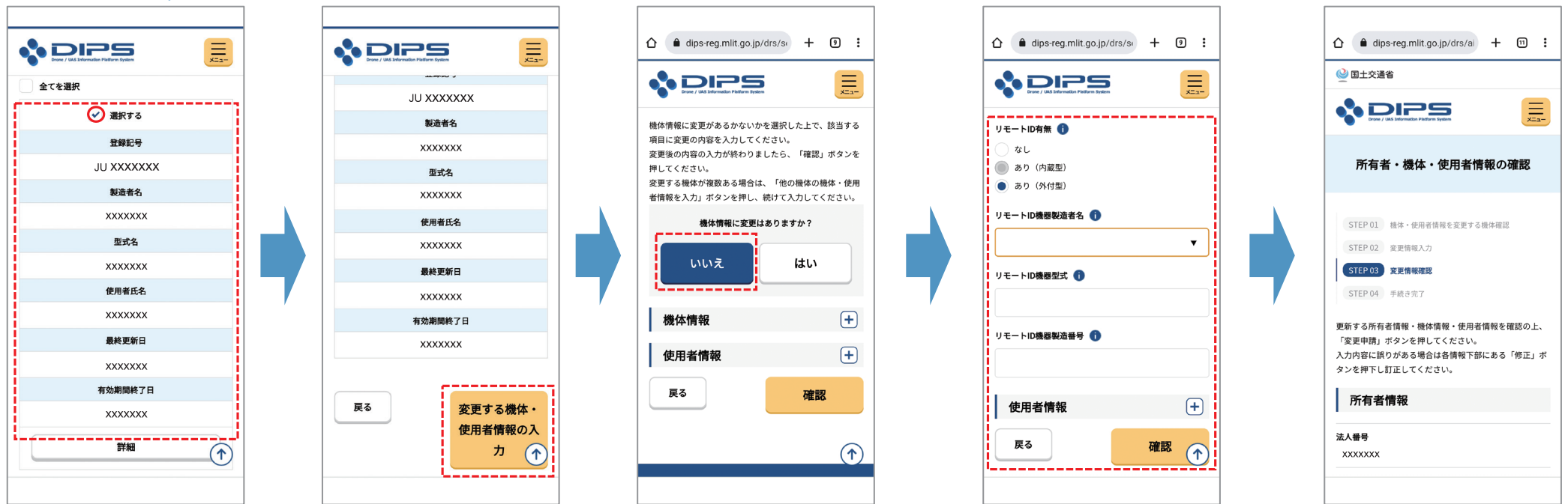
(5)機体と使用者情報の確認/変更画面より、登録する機体を選択し、画面下部の機体・使用者情報の変更ボタンを押下します